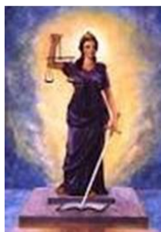
Amada Señora Porthia