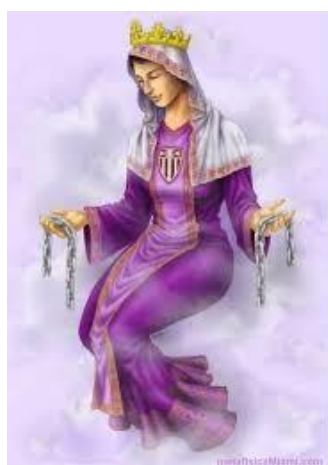
Amada Señora Mercedes