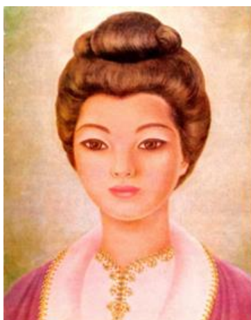
AMADA KWAN YIN