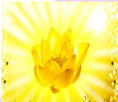
Amada Lady Soo chee