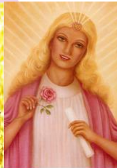
Amada Lady Nada